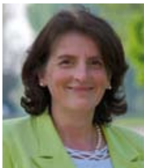
Tiziana Virgili Presidente Provincia

La pubblicazione di questo magazine, che raccoglie gli appuntamenti culturali che si svolgeranno nella provincia di Rovigo da giugno a dicembre di quest'anno, è il primo traguardo di un nuovo progetto culturale: la costituzione di una rete fra comuni, enti ed istituzioni, associazioni che operano nel mondo dello spettacolo dal vivo e dell'organizzazione e promozione di eventi, per la realizzazione sul territorio polesano di un ricco cartellone culturale congiuntamente ideato ed elaborato, allo scopo di poter creare un'offerta organica e di qualità.